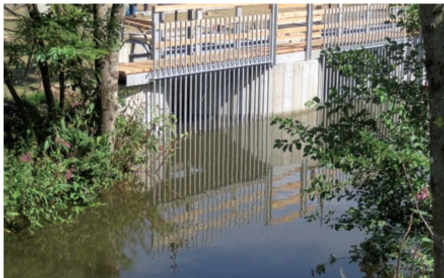
Bild 5 Ein in die Uferböschung integriertes GWVPP im österreichischen Wimitz.

Da GWVPPs nahe bei den Verbrauchern liegen, können etwa 12% an Übertragungsverlusten gegenüber Atomkraftwerken eingespart werden. Somit ersetzen 30 000 dezentral gelegene 20-kW-GWVPPs mit Gesamterrichtungskosten von 4950 Mio. Euro ein 600-MW-AKW. Trotz der grossen Anzahl an GWVPPs können diese wegen ihrer geringen Fallhöhe unscheinbar ( Bild 5 ) in die bestehende Fließgewässerlandschaft integriert werden. In Europa gibt es rund 5 Millionen potenzielle Standorte für GWVPPs.