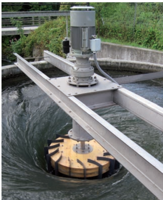
Bild 1 Das kompakte 10-kW-GWVPP mit Asynchrongenerator, Planetengetriebe und Zotlöterer-Turbine in Obergrafendorf, Österreich, produziert jährlich 60 000 kWh.

Im Rotationsbecken entsteht über der mittigen Abflussöffnung ein Gravitationswasserwirbel, der in seinem Zentrum die Zotlöterer-Turbine – im Folgenden auch einfach Turbine genannt – samt elektrischem Generator antreibt. Unterhalb des Rotationsbeckens fließt das Wasser wieder zurück in das Fließgewässer. Fische und Kleinlebewesen können das GWVPP unbeschadet durch die Turbine oder ohne besondere Kraftanstrengung über eine flache Rampe im Aussenbereich des Rotationsbeckens sowohl stromauf- als auch stromabwärts passieren. Im betroffenen Gewässerabschnitt entsteht keine Restwasserstrecke und Hochwasser kann problemlos über das niedrige Wehr und durch den geöffneten Grundablass abgeführt werden.