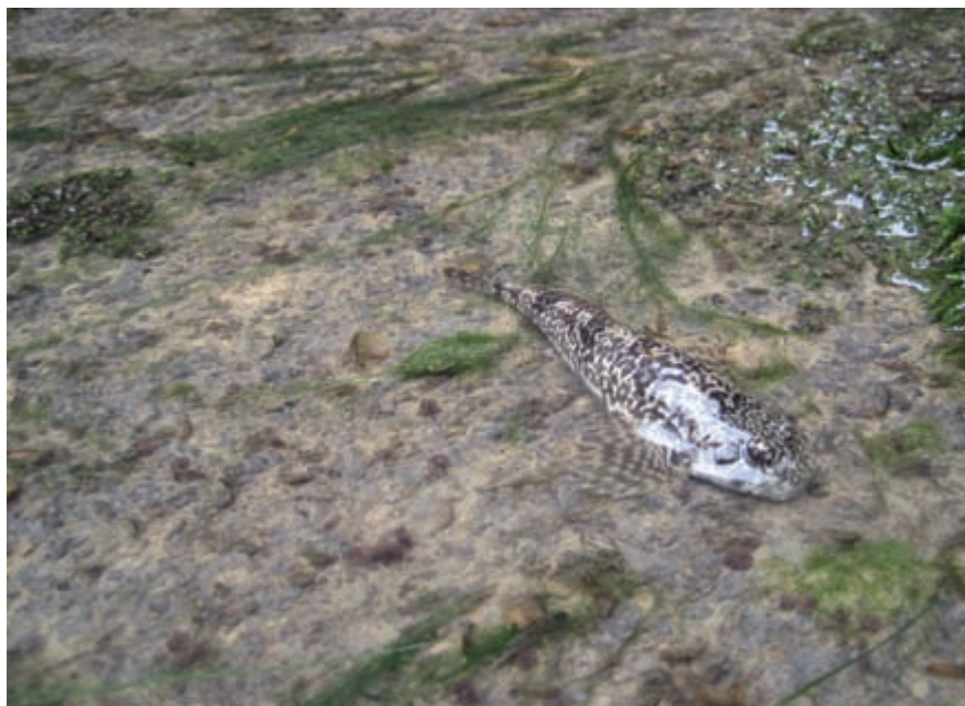
Bild 4 Kleinlebewesen und Fische im Rotationsbecken eines GWVPP.

stetig beschleunigend, in Richtung Wirbelzentrum auf die Turbine zu. Ähnlich wie bei einem Wasserfall zieht sich dabei ein Wasserfaden in Fallrichtung bzw. hier in Strömungsrichtung auseinander. Dazwischen wird Luft in die spiralförmige Wasserströmung eingesogen und durch den Gravitationswasserwirbel stetig an die Innenwand- und Bodenfläche des Rotationsbeckens geführt. Dort siedeln sich in kurzer Zeit je nach Nährstoffgehalt und Temperatur des durchströmenden Wassers gewässerspezifische Wasserpflanzen (u.a. Quellmoose) an. Diese bilden einen gut durchlüfteten Lebensraum für Kleinlebewesen (u.a. Bachflohkrebse, Köcherfliegenlarven) und Fische ( Bild 4 ).